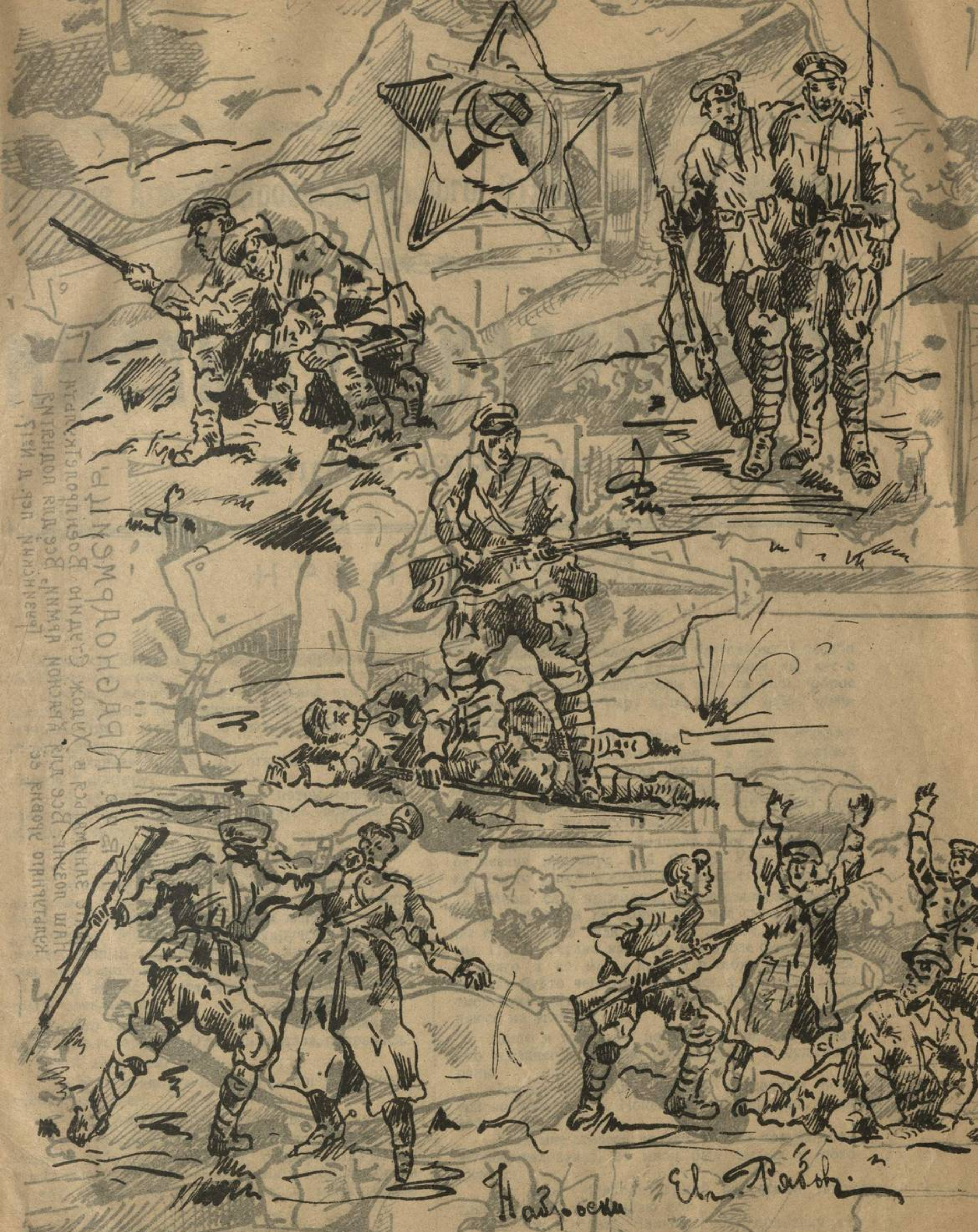
Подвиги нашей доблестной Красной армии на фронте.