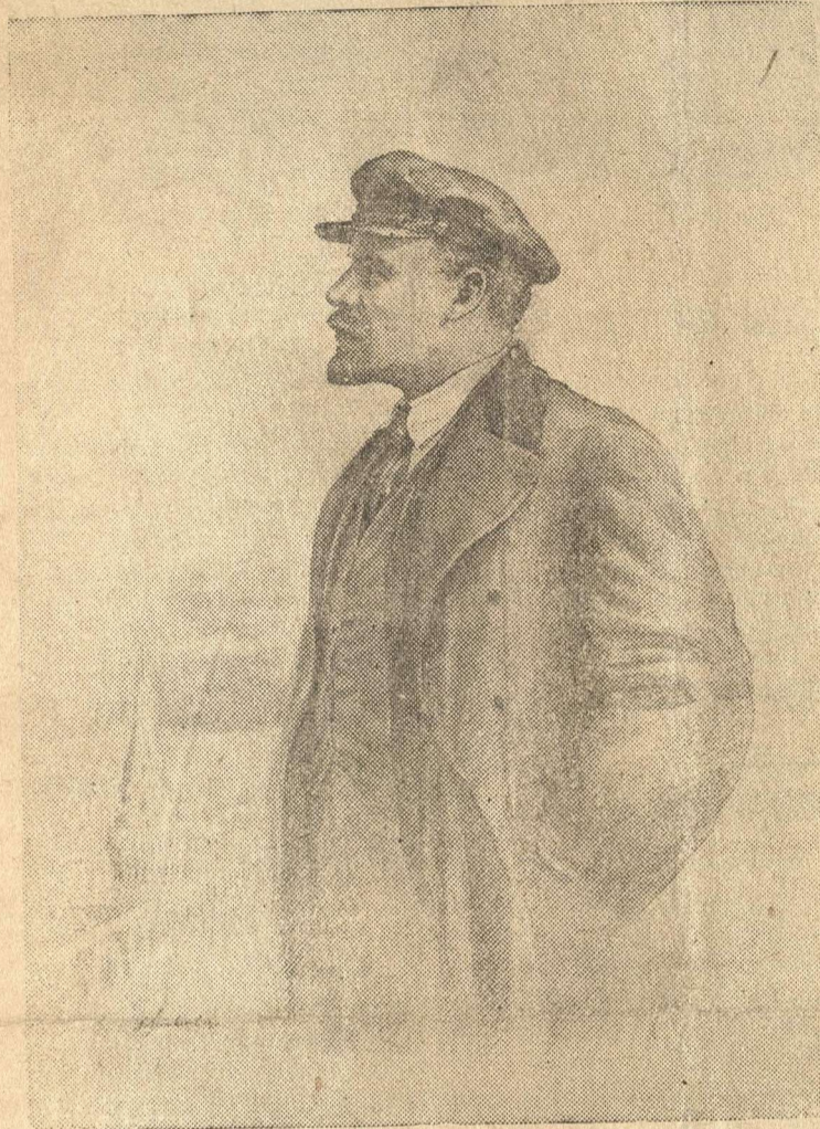
В. И. Ленин.

(С рисунка — работы художника Ф. Литвинова)