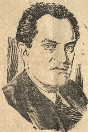
В. В. Куйбышев.

С этого момента начинается его жизнь профессионала-революционера, жизнь, полная опасностей и лишений. Он перебирается из одного города в другой, работает в большевистском подполье. Полиция не оставляет его в покое: его арестовывают, сажают в тюрьму, отправляют в ссылку. Но трудности и невзгоды не пугают его. Преходит некоторое время, и Куйбышев снова на партийной работе.