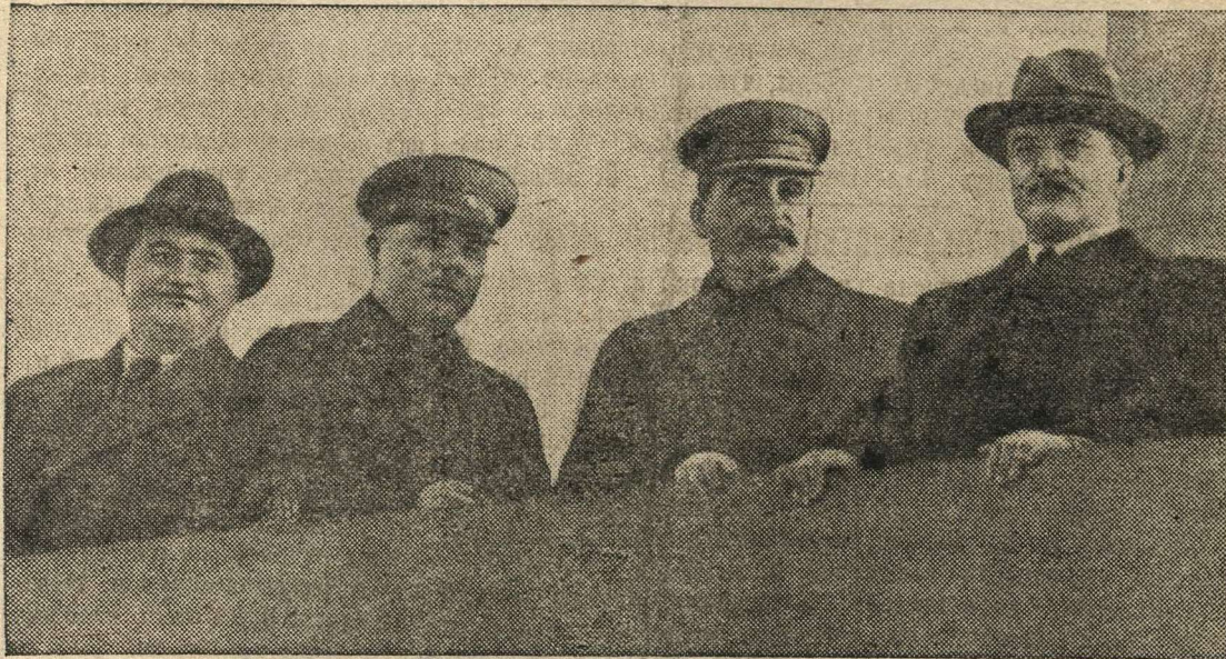
Справа налево: товарищи В. М. Молотов, И. В. Сталин, К. Е. Ворошилов, и Г. М. Димитров на трибуне мавзолея.