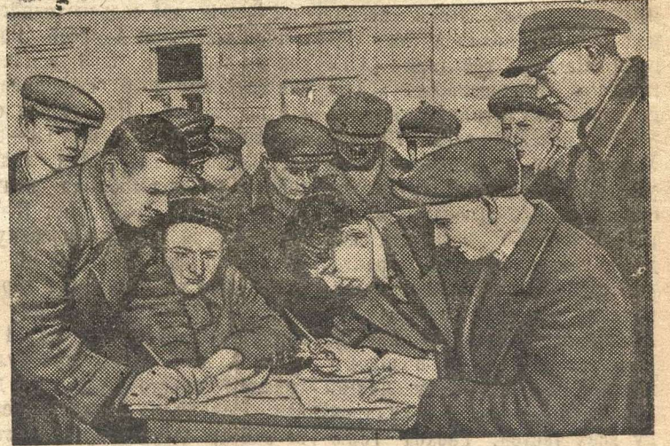
Годписка на Заем Третьей Пятилетки (выпуск четвертого года) в колхозе имени Горького (Ленинский район, Московская область).