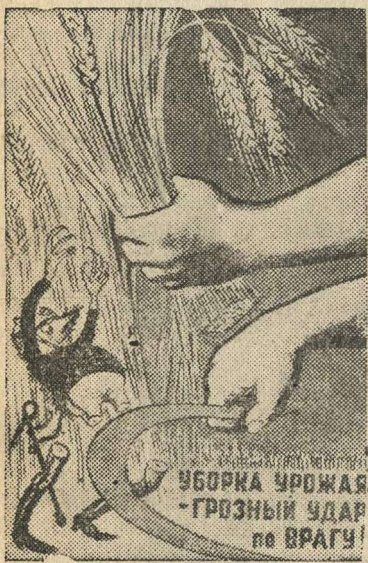
Рисунок худ. Кукрыниксы. (Репродукция с плаката, выпущенного издательством «Искусство»).