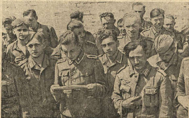
Группа пленных немцев.