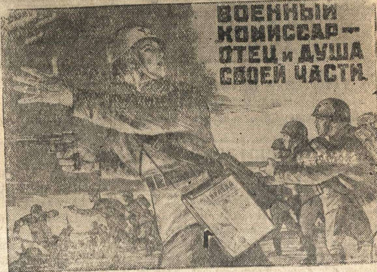
Рисунок художника Мальцева. (Репродукция с плаката, выпускаемого издательством «Искусство»).

которые будучи обстреляны зенитным огнем, беспорядочно сбросили несколько фугасных бомб мелкого калибра и небольшое количество зажигательных бомб. Три жилых здания получили незначительные повреждения.