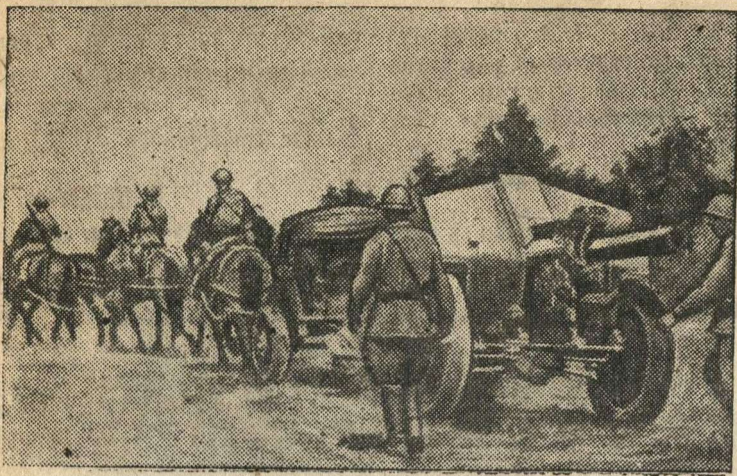
Советские артиллеристы продвигаются на передовые позиции.

(Съемка специальных корреспондентов Союзкиноармии). Фотохроника ТАСС.