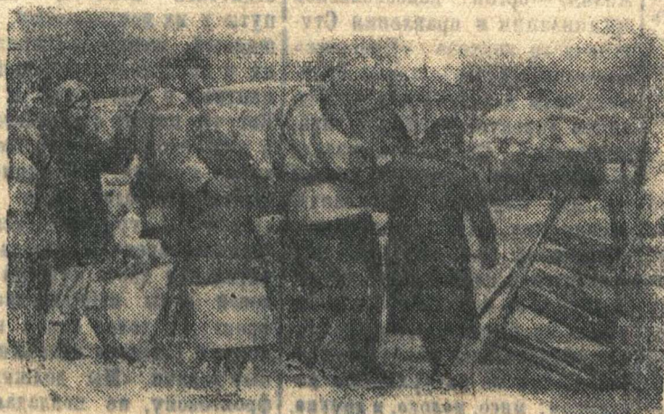
Партизаны вернулись в родное село С. после освобождения его от немцев. Радостно их встретили родные и близкие.

Срок действия решения ис- полкома от 4 февраля 1940 года «О борьбе с брадачами и бешеными собаками» прод- лить до 4 февраля 1944 года.