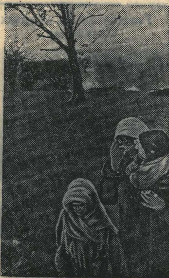
В секе Серболово Ленинградской обл., сожженом гитлеровскими захватчиками.