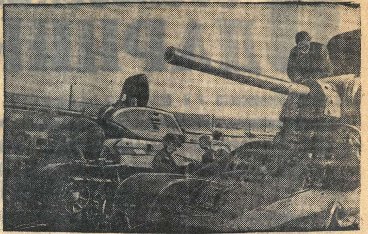
Последняя проверка танков на Нском танковом заводе перед отправкой на фронт.