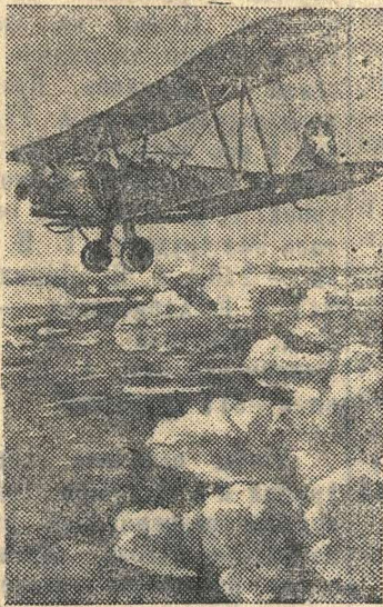
На снимке: Связной самолет Н-ской авиации, скрывающейся за облаками, летит на выполнение задания в тыл врага.