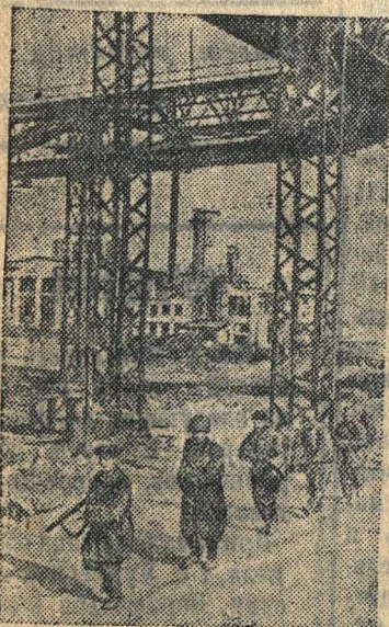
На снимке: Отделение бойцов рабочего батальона одного из заводов, защищающих родное предприятие.