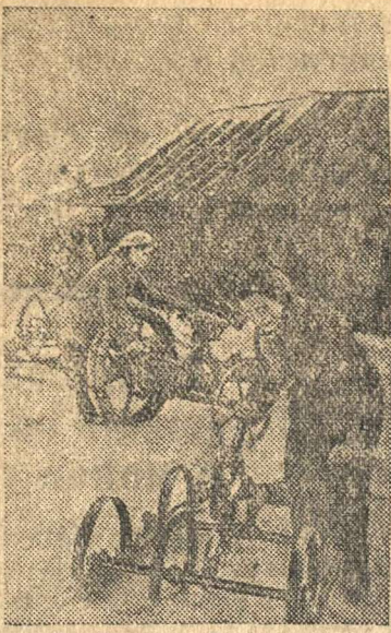
Комсомолы колхоза «Первое Мая» (Ивановский район, Ивановская область) ремонтируют сельскохозяйственный инвентарь.