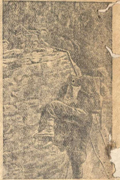
На снимке: Бойцы Н-ского горно-стрелкового отряда, выполняющая боевое задание, взбираются на скалы.