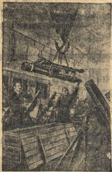
На снимке: Упаковка готовых минометов.