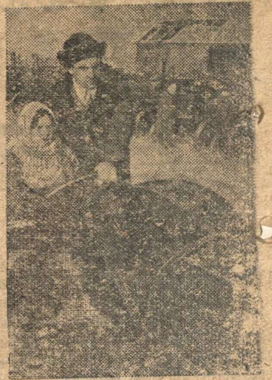
На курсах трактористов Кузнецкой МТС (К мероская область) обучается 60 человек.

Свинарка колхоза «Красная гора» Брейтовского района Ярославской области.