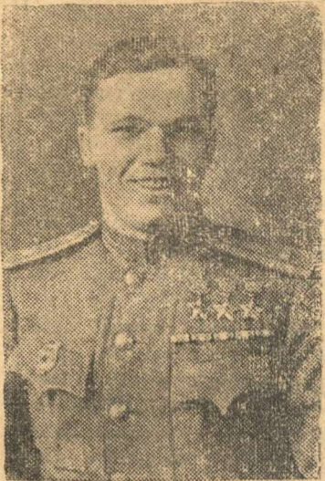
Трижды Герой Советского Союза гвардии майор Иван Никитович Кожедуб.

Колхозники и колхозницы, коммунисты и комсомольцы! Не дадим погибнуть ни одному килограмму картофеля. Все, как один, выйдем на уборку!