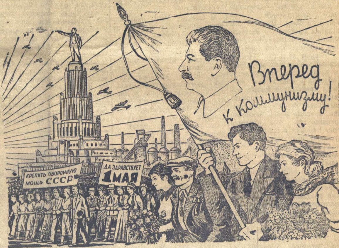
Рисунок Б. Уханова.