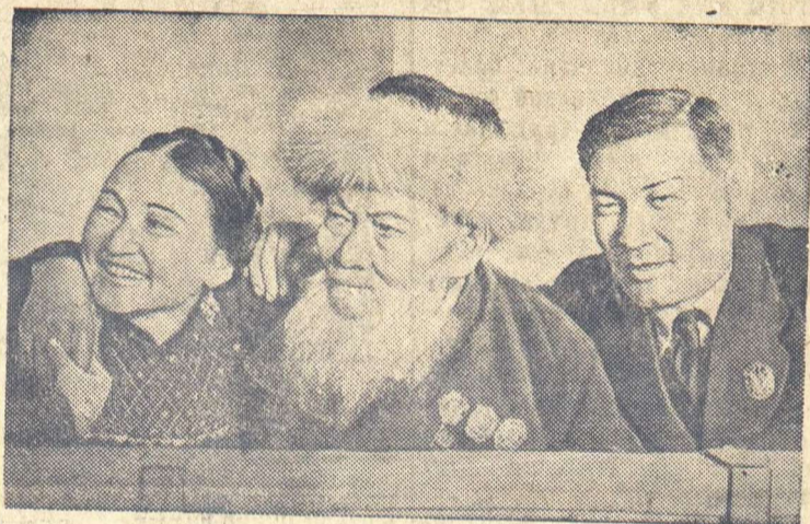
Лауреат Сталинской премии, трижды орденосец Джемал Джабаев (в центре), народная артистка СССР орденосец Кулаш Байсеитова и поэт орденосец Т. Жарков.