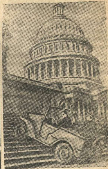
Испытание нового автомобиля выпущенного для американской армии (США).

Агентство Рейтер передает, что как стало известно, во время бомбардировки Лондона в ночь на 11 мая были причинены повреждения зданию парламента, Вестминстерскому аббатству и Британскому музею. (ТАСС).