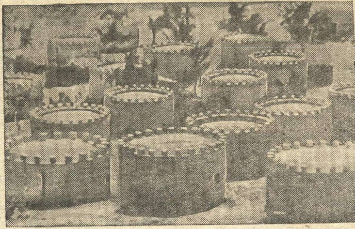
Жилища туземцев в Аддис-Абебе (Абиссиния).