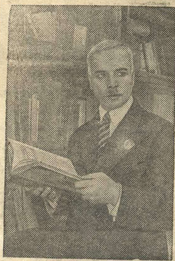
Таджикский поэт и драматург дважды орденносец А. Лахути в своем кабинете.