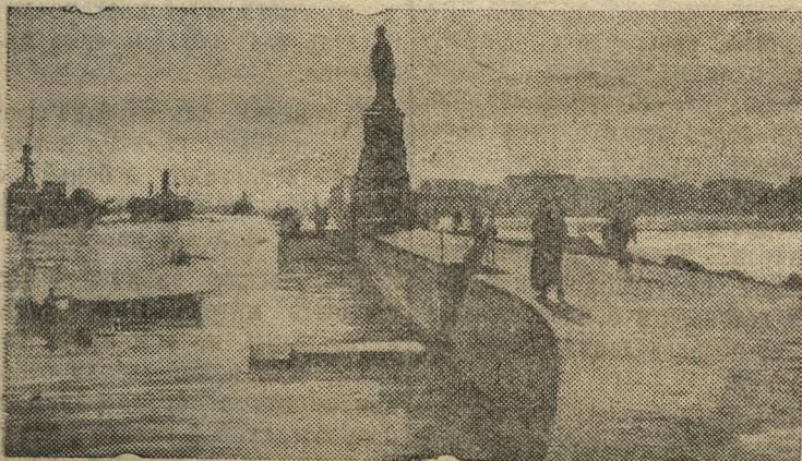
Порт Саид. Вход в Суэцкий канал.