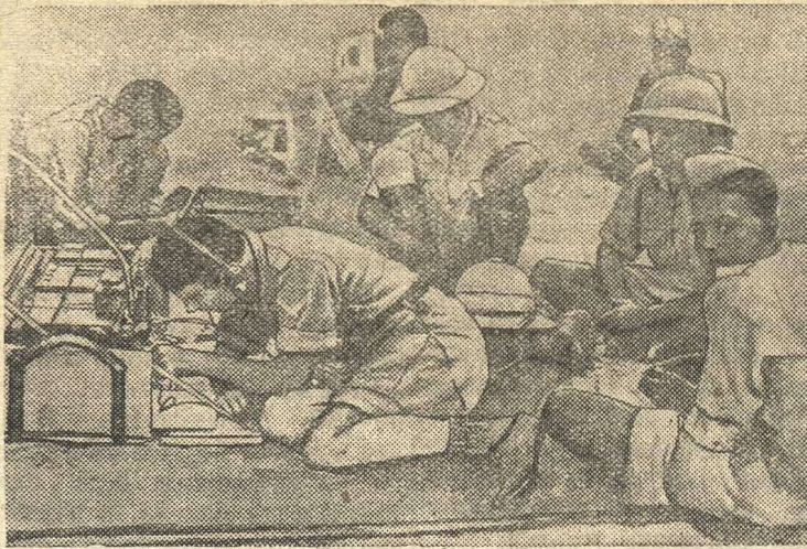
Полевая радиостанция абиссинских партизан.