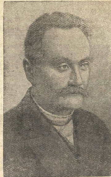
И. Я. Франко.

В стихотворении «Дума в тюрьме» поэт говорит: