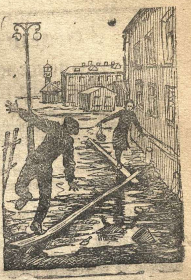
Узкие места в работе исполкома горсовета.