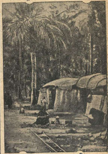
Туземное жилище в столице Прага Бадате.