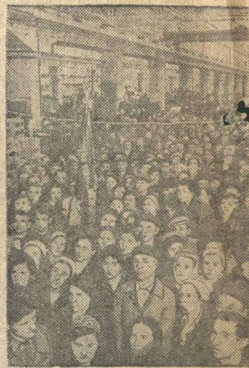
Митинг на Московском заводе «Динамо» имени Кирова в связи с заявлением заместителя Председателя Совнаркома СССР и Народного Комиссара Иностранных Дел тов. В. М. МОЛОТОВА (22 июня 1941 г.).