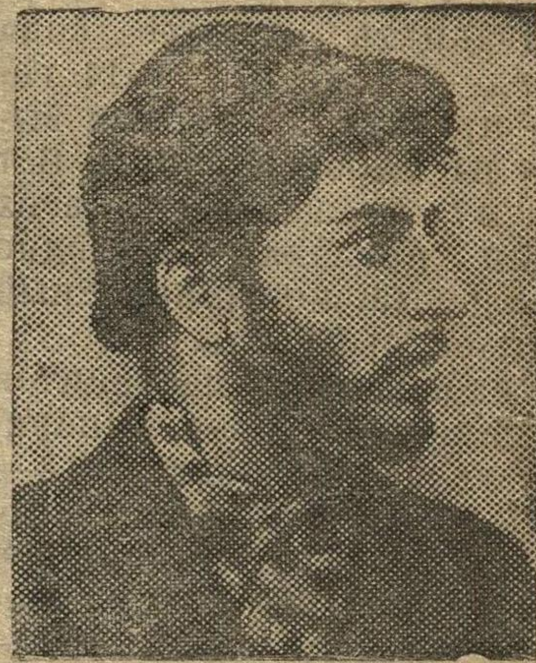
На сн.: И. В. Сталин (1901—1903 гг.)