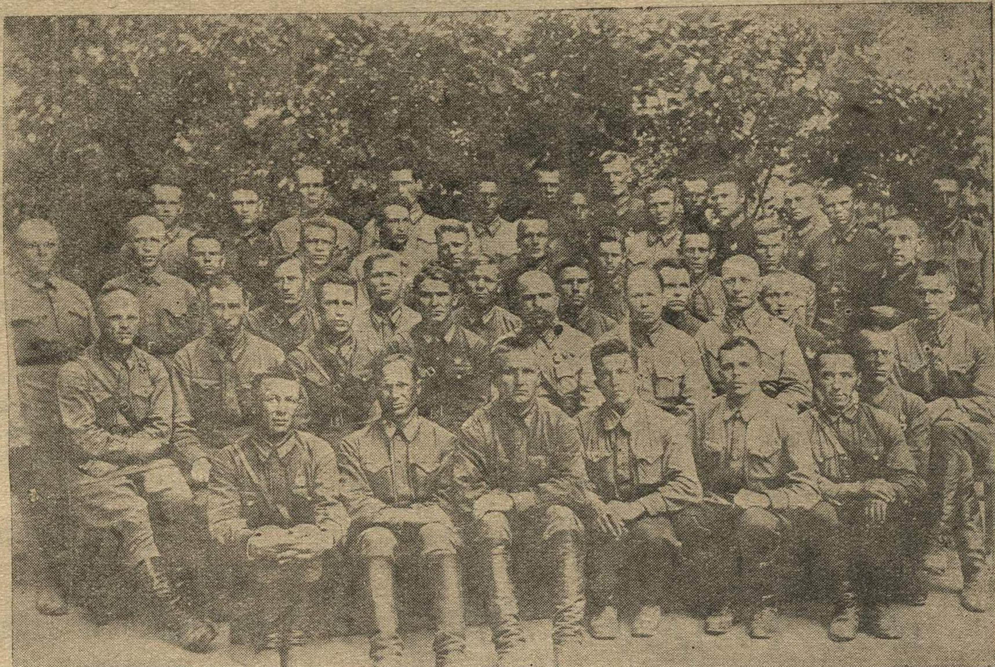
Группа курсантов лагсбора РКМ, окончивших учебу на „хорошо“ и „отлично“.

Одним из важнейших участков, обеспечивающих успешное прохождение учебы, является хозяйственная работа; но надо отметить,