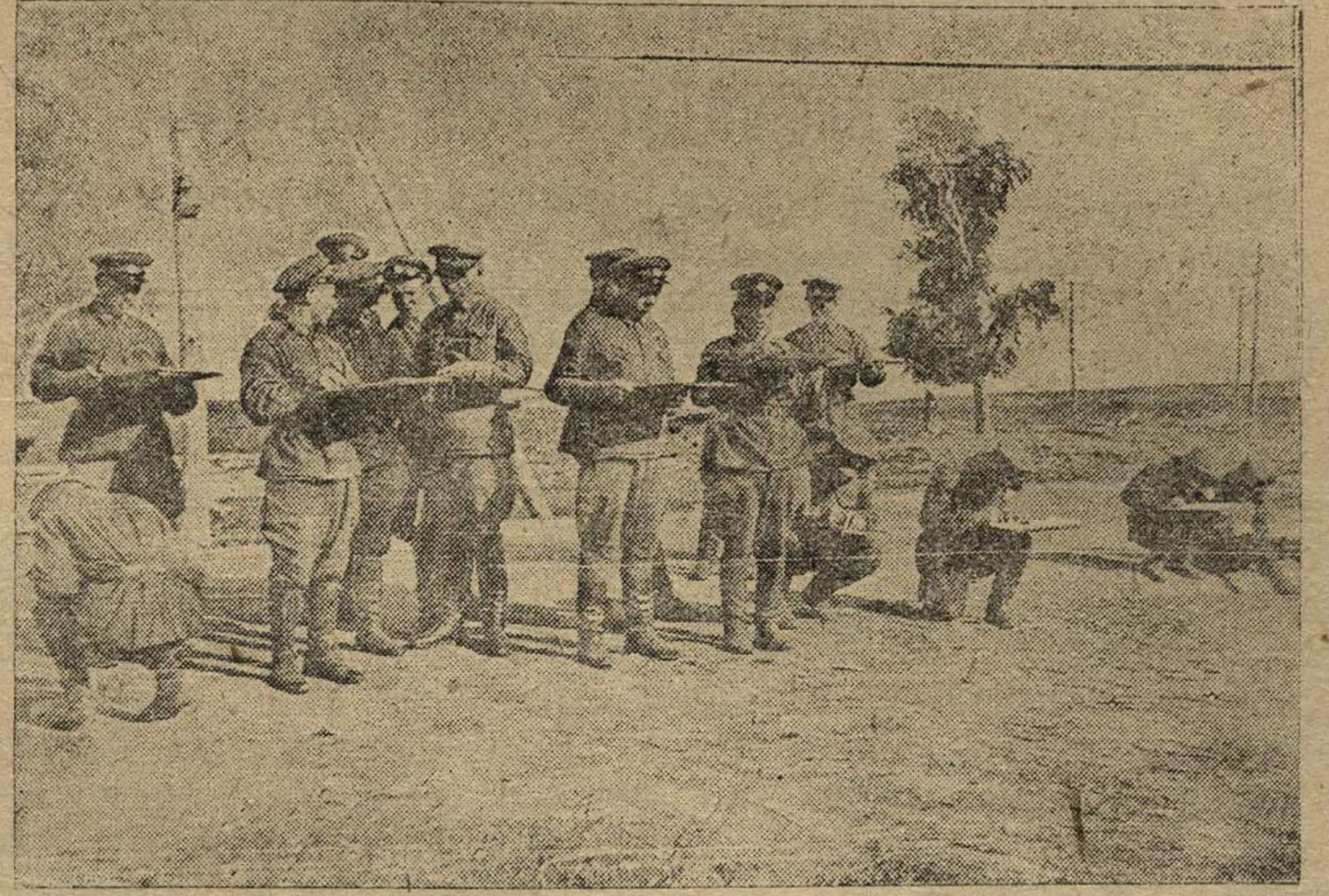
Группа курсантов лагсбора РКМ на практических занятиях по топографии