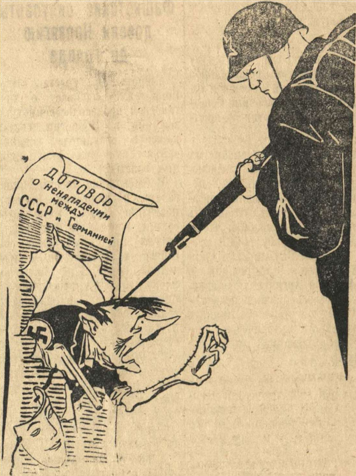
Беспощадно разгромим и уничтожим врага!

(Репродукция с плаката, выпущенного издательством «Искусство».)