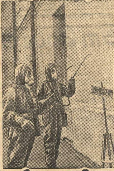
Очередное занятие дегазационного отделения.

Комсомольская унитарная команда МПВО Юридического института Прокуратуры Союза ССР (Москва).