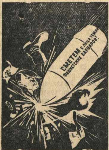
Рисунок художника Н. Долгорукова. (Репродукция с плаката, выпущенного издательством „Искусство“).

ЛИНЕВ, председатель исполкома Гугинского сельсовета.