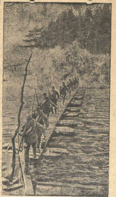
Форсирование водной преграды.