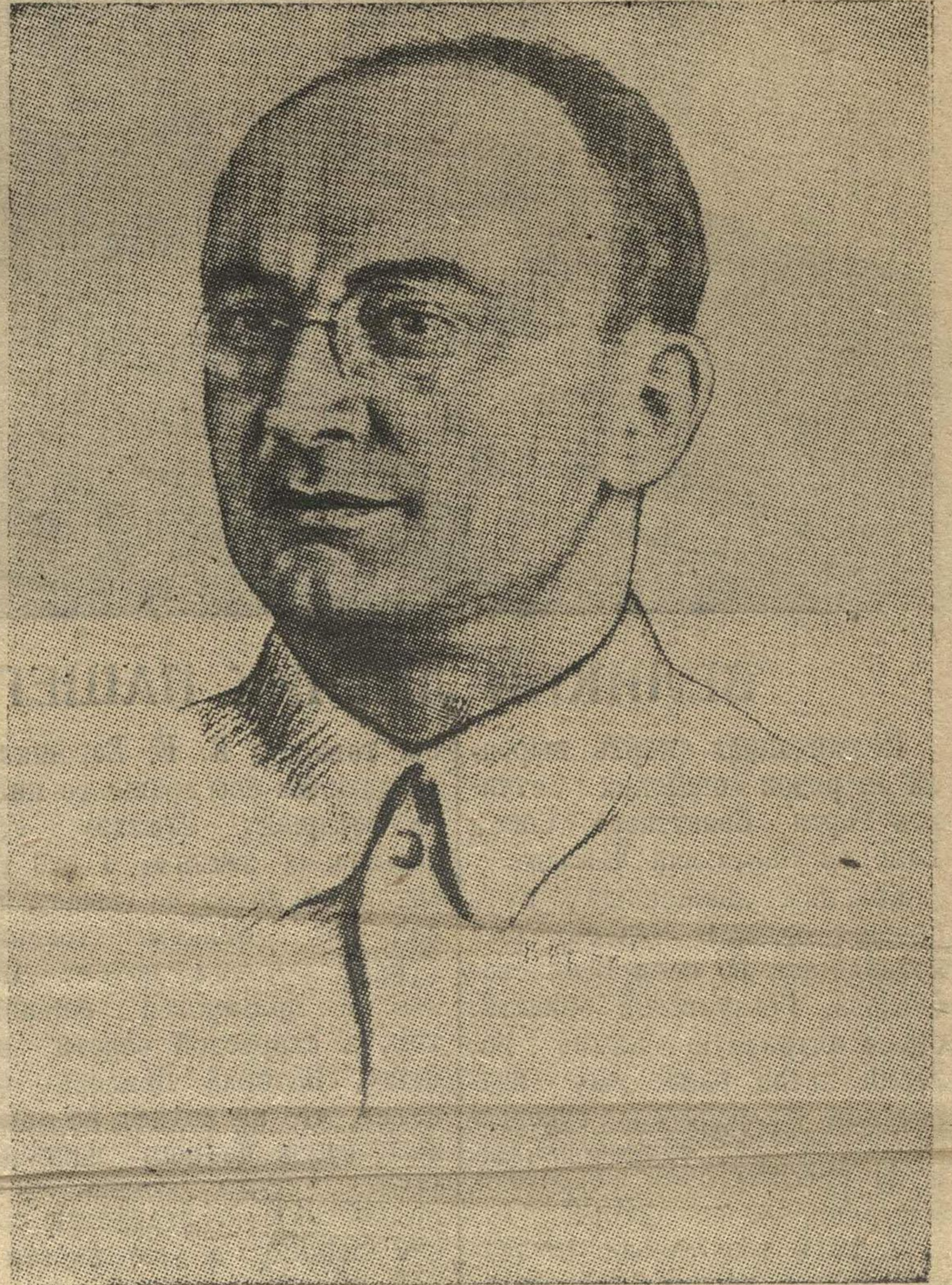
Народный Комиссар Внутренних Дел СССР товарищ БЕРИЯ

Мы можем пожелать, чтобы работники НКВД и впредь, служа народу, были преданными сынами ленинско-сталинской партии и хранили чекистский завет Феликса Дзержинского — бороться за дело народа и всегда быть на-чеку, чтобы ни один предатель не ускользнул от карающего меча пролетарской революции. (Микоян).