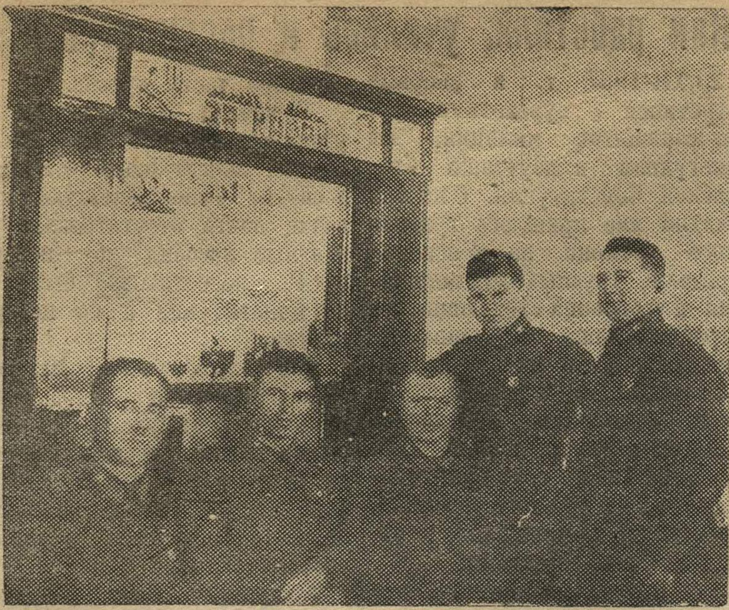
Редакция стенгазеты «За кадры» курсов сержантов РКМ выпустила выпускной номер газеты.