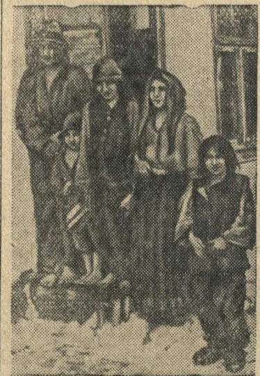
Доведенная до крайней нищеты румынская семья.

Румынские бояре довели румынский народ до полной нищеты и разорения. Население терпит голод, оно не имеет средств, чтобы купить одежду и обувь.