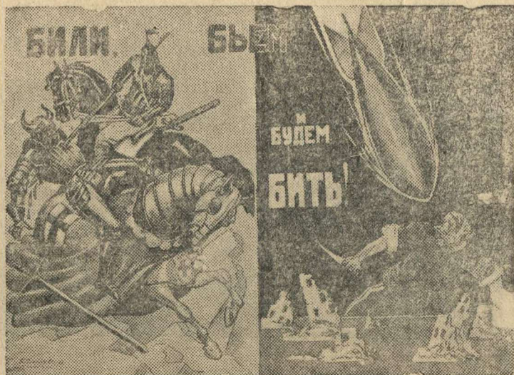
Рисунок худ. П. Соколова-Скаля и М. Соловьева. (Репродукция с плаката, выпущенного издательством «Искусство»)