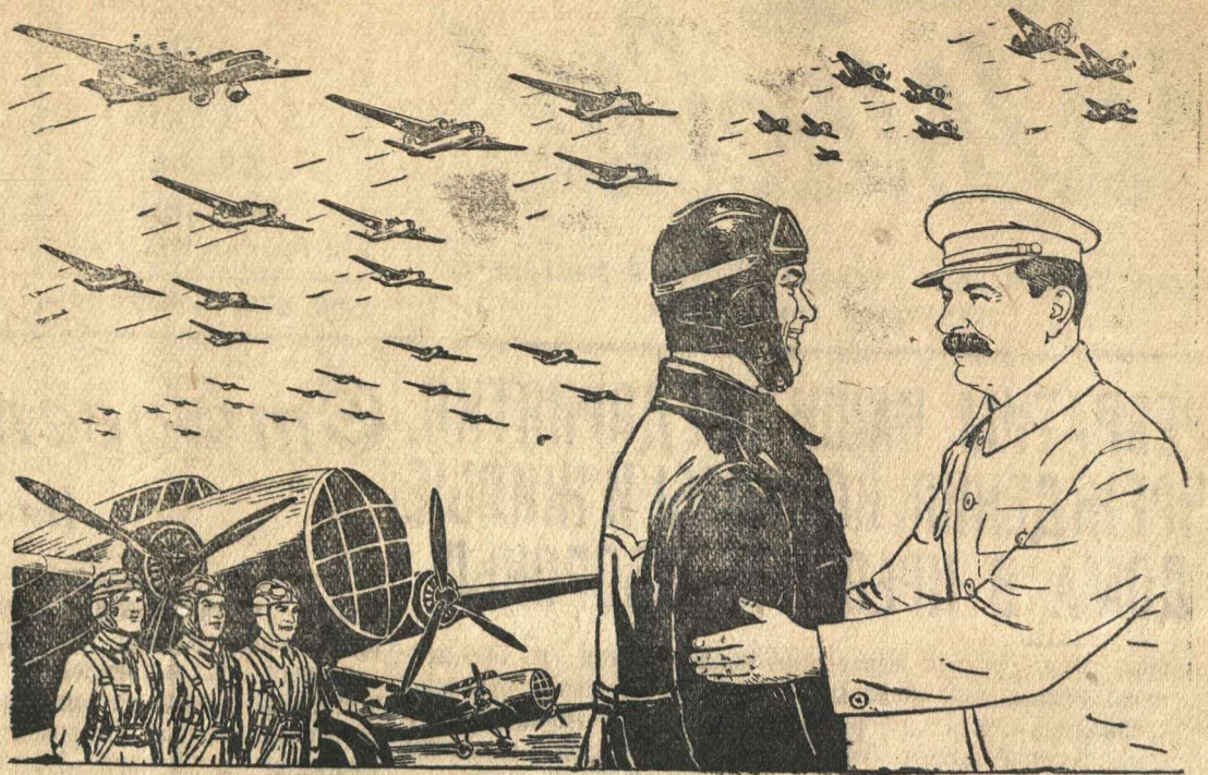
Рисунок В. Баркова и В. Лисевича.

Берлинское радио снова повторяет уже разоблаченную Советским Информбюро ложь о том, что советские пилоты якобы применяют пули «дум-дум». Очередное гнусное измышление отличается от уже разоблаченного лишь тем, что новые «пули», отлитые в Берлине, пали по воле изолгавшихся фашистов не на железнодорожный состав, а на немецких солдат. Повторение немцами уже опровергнутой провокационной выдумки свидетельствует о настойчивой попытке гитлеровцев скрыть свои замыслы и замести следы собственных зверств. Очередная грязная клевета озлобленных фашистов рассчитана, видимо, на то, чтобы ослабить впечатление, произведенное на немецкий народ героическими действиями советской авиации, успешно расстраивающей авантюристские планы гитлеровского командования.