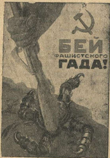
Рисунок художника Кокорекина (Репродукция с плаката, выпущенного издательством «Искусство»).

Соглашение между СССР и Англией о совместных действиях в войне против итлеровской Германии встречено всем советским народом с единодушным одобрением.