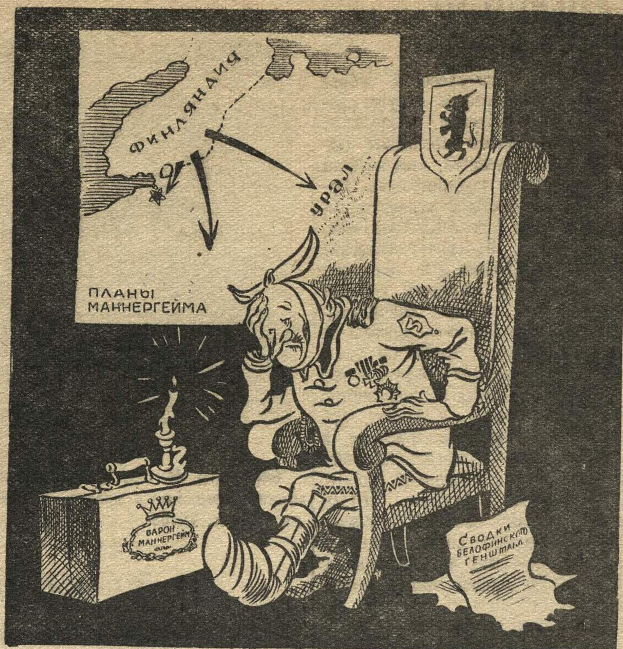
МЕЧТЫ, МЕЧТЫ, ГДЕ ВАША СЛАДОСТЬ...

ЛЬВОВ. В городе Кременец-львовский трест «Шахтстрой» заложил две угольных шахты. В одной из шахт уже добыты первые 300 тонн высококачественного бурого угля, который используется местной электростанцией. На протяжении года будет построено 17 новых шахт.