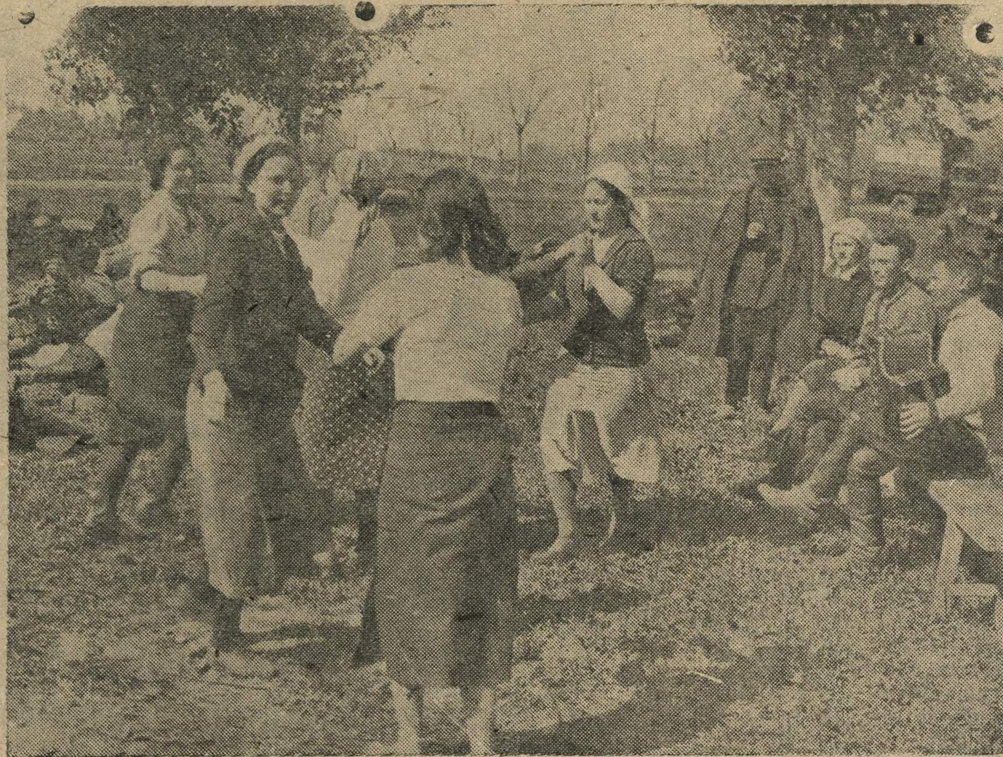
Участники строительства дороги Горький—Муром—Кулебаки во время обеденного перерыва.