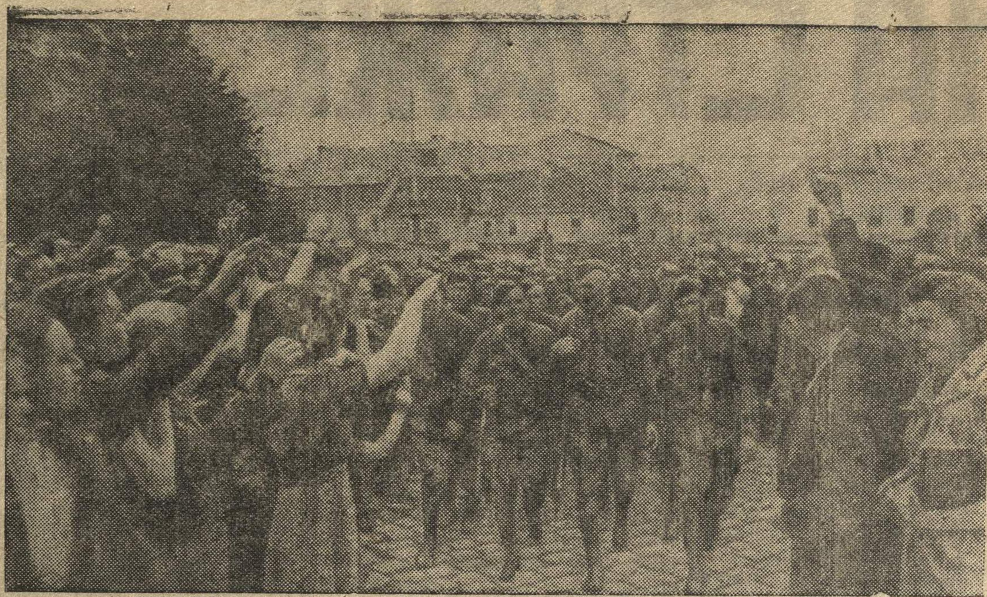
Жители окрестностей гор. Черновицы радостно приветствуют части Красной Армии.

А отсюда не случайно у тов. Лапшова сложилось политически-ошибочное мнение о работниках 3-го отделения Автозаводского ГОМ. «Позвольте, какую вы требуете помощь, когда работники вашего аппарата почти все коммунисты и комсомольцы?».