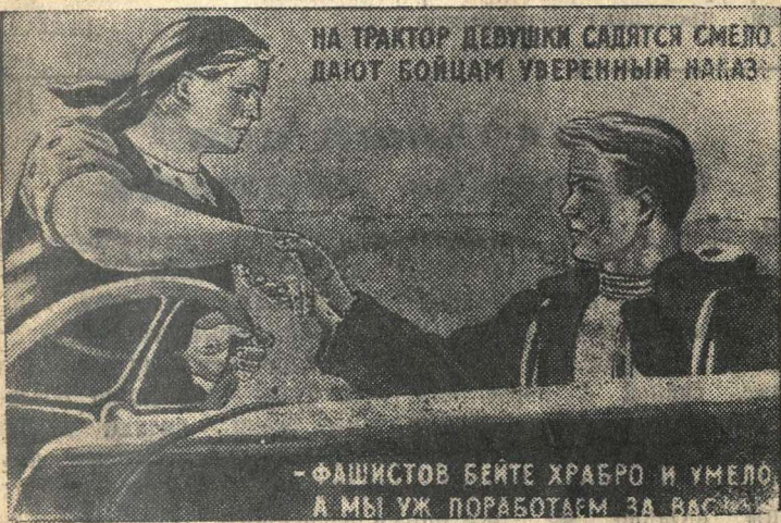
Рисунок Т. Ереминой.

(Репродукция с плаката, выпускаемого издательством «Искусство»).