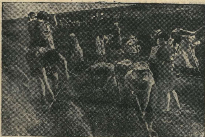
В прифронтовой полосе.

Бернский корреспондент газеты «Ивнинг Стандарт» передает, что согласно сообщению берлинского корреспондента «Трибюн де Женев», частые воздушные тревоги начинают действовать на нервы берлинцев, которые спрашивают, что это за бомбардировщики, откуда они прилетают и означает ли их появление начало нового этапа войны. Бомбардировщики летают так высоко, что их едва обнаруживают звукоулавливатели самого последнего образца. Характерно, что во время этих налетов господствует полная тишина, германские зенитчики даже не открывают огня, что вызывает еще большее раздражение у населения. (ТАСС).