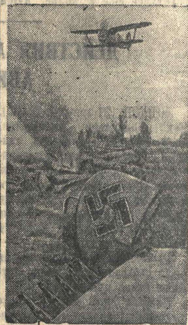
Славный советский сокол парит над сбитым им фашистским стэрвятиником.