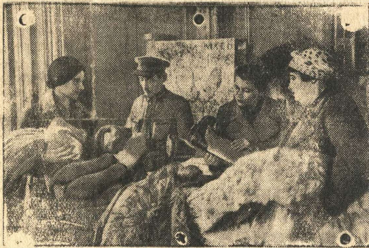
Трудящиеся Ленинграда — бойцам фронта.

Патриоты города Ленина приносят на пункты и сдают теплые вещи для бойцов Действующей Красной Армии. Уже собрано много валенок, полушубков, теплого белья, свитеров.