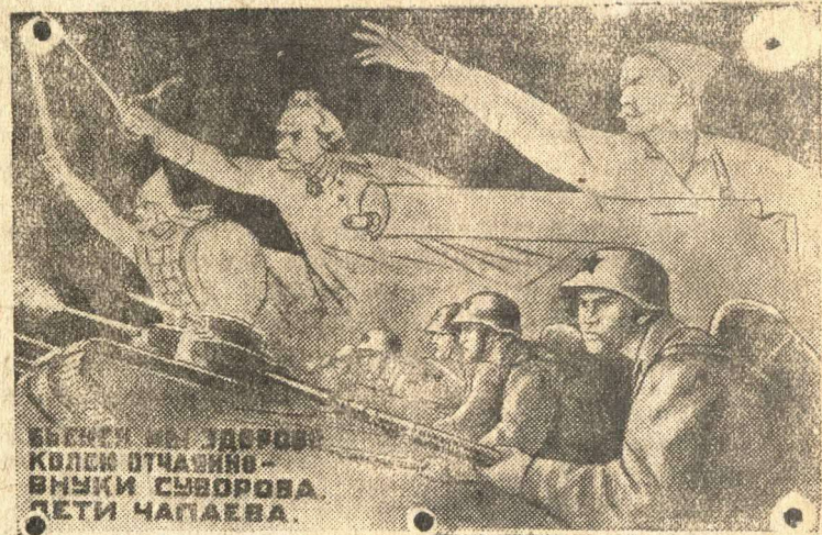
Рисунок художников Кукрыныксы.

В районе пунктов Д. и А. наши войска продолжают активные действия, настойчиво тесня противника. Подразделения командира Трубачева, форсировав водную преграду, сразу же вступили в бой с оккупировавшими фашистами. Несмотря на упорное сопротивление, немцы были выбиты с занимаемых ими позиций. Вчера подразделения Трубачева достигли населенного пункта Б., на окраинах которого происходят ожесточенные схватки с врагом.