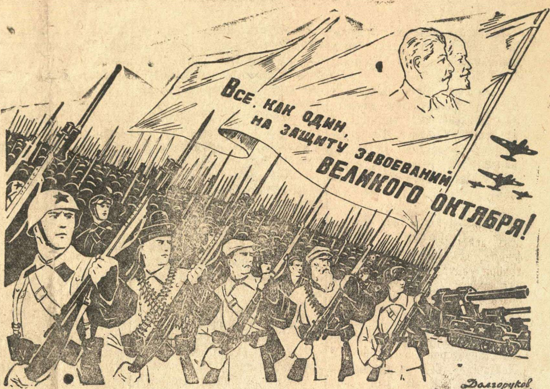
Рисунок художника Долгорукова. (Фотохроника ТАСС).

ДА ЗДРАВСТВУЕТ XXIV ГОДОВЩИНА ВЕЛИКОЙ ОКТЯБРЬСКОЙ СОЦИАЛИСТИЧЕСКОЙ РЕВОЛЮЦИИ, СВЕРГНУВШЕЙ ВЛАСТЬ ИМПЕРИАЛИСТОВ В НАШЕЙ СТРАНЕ И ПРОВОЗГЛАСИВШЕЙ МИР МЕЖДУ НАРОДАМИ ВСЕГО МИРА!