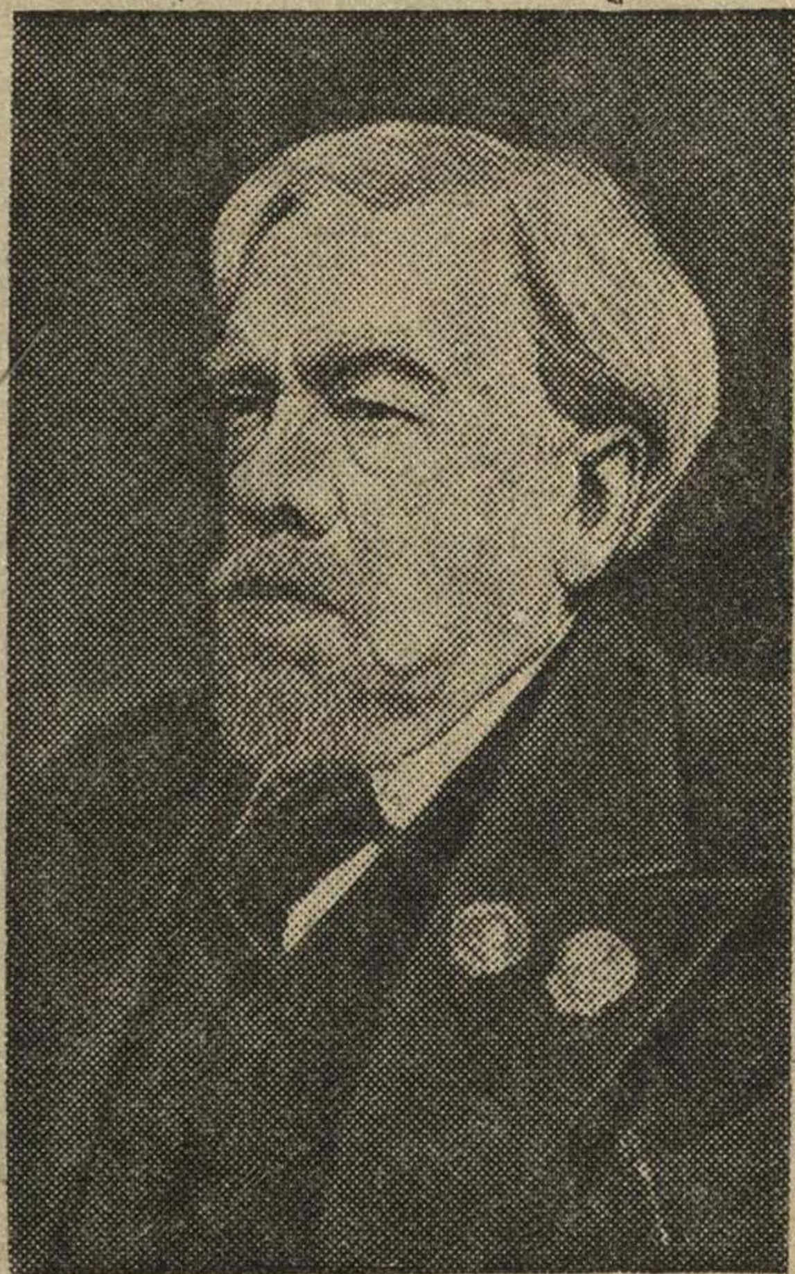
Герой Социалистического Труда академик Сергей Алексеевич Чаплыгин.

В передовом органе РКМ нашей области — Дзержинском горотделе — надо организовать дело партийной пропаганды так, чтобы в ближайшее время добиться коренного улучшения в работе личного состава над повышением своего идейно-политического уровня.