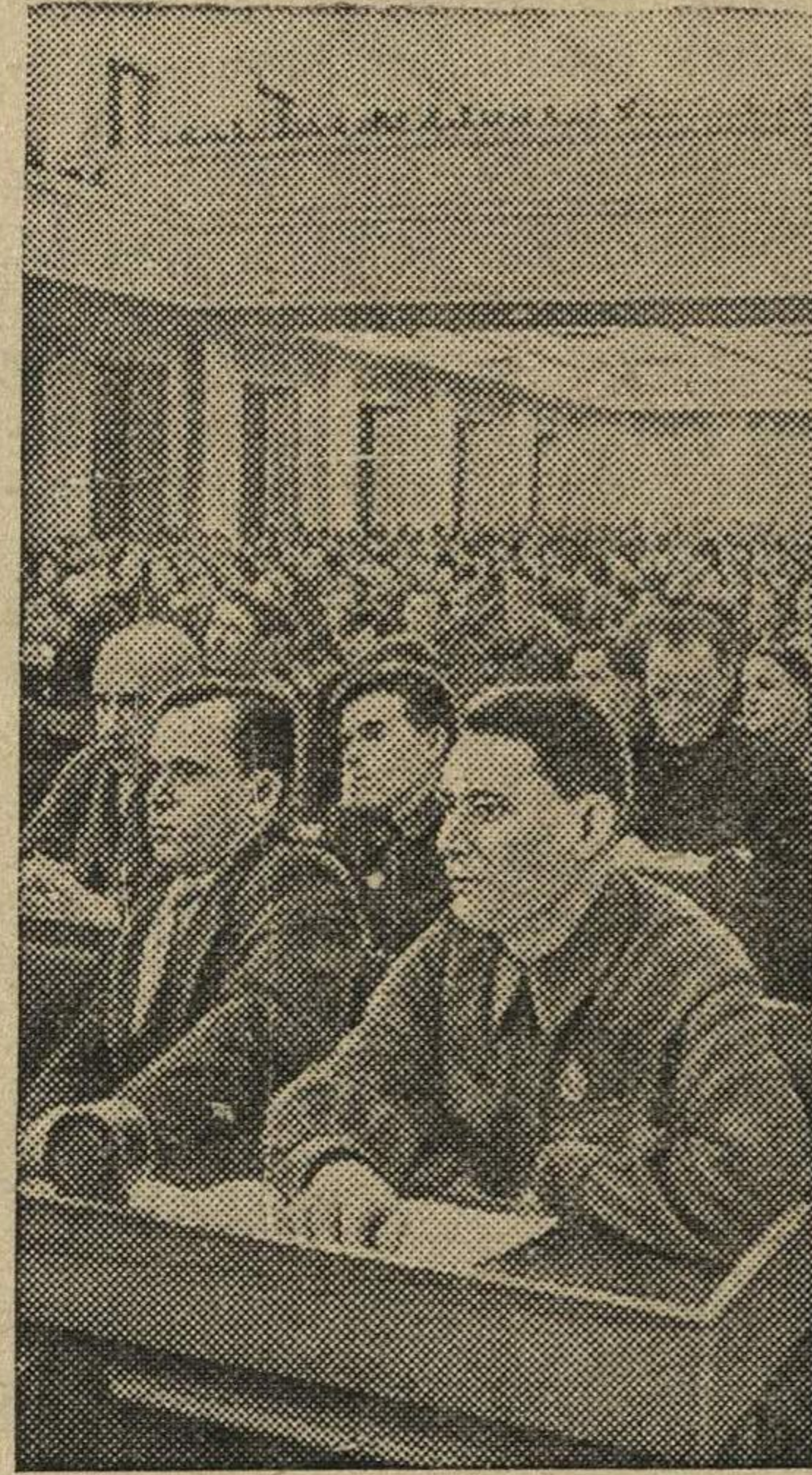
В зале заседания.

15 февраля в Большом зале Кремлевского дворца открылась XVIII Всесоюзная конференция ВКП(б).