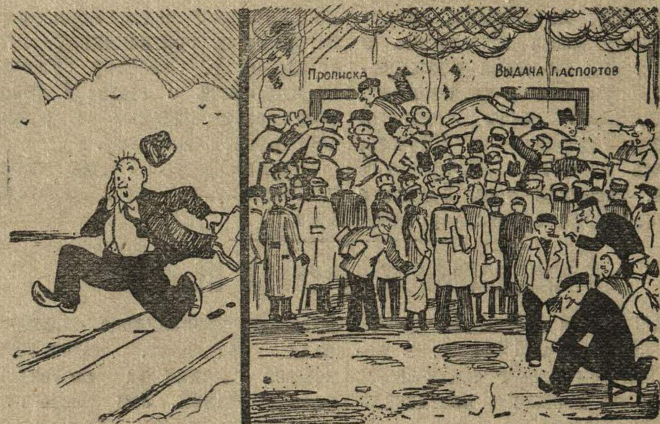
Так выглядит паспортный стол 5 горотделения.