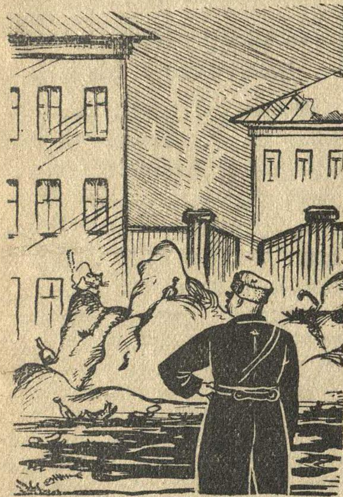
Милиционер:—Вот и попробуй тут бороться за чистоту, когда во двор даже не проберешься.