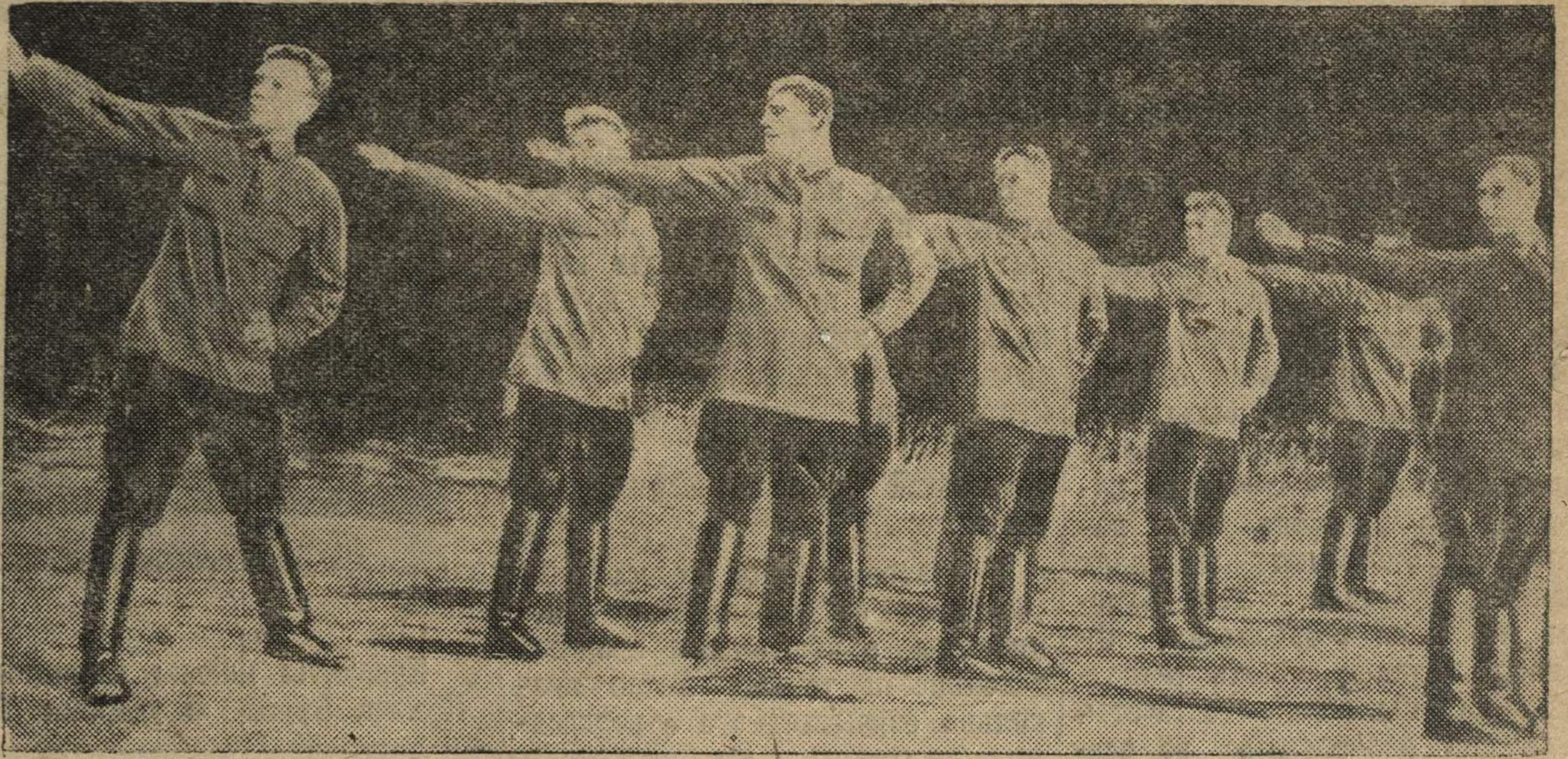
Физкультурная зарядка в 4 горотделении.