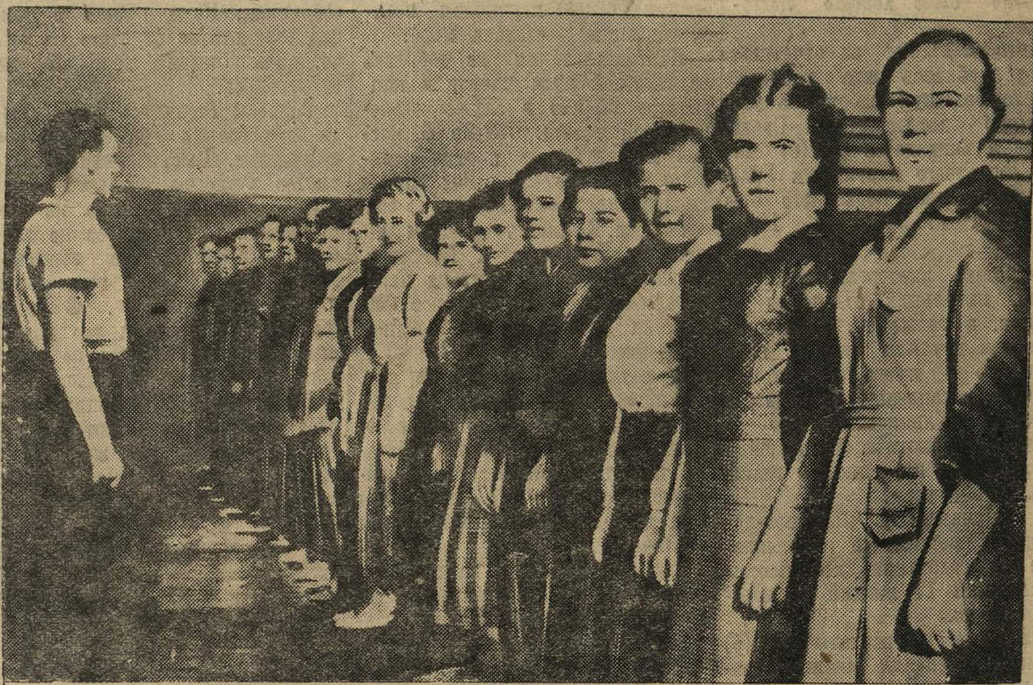
Работники Управления милиции выстроились на физзарядку.