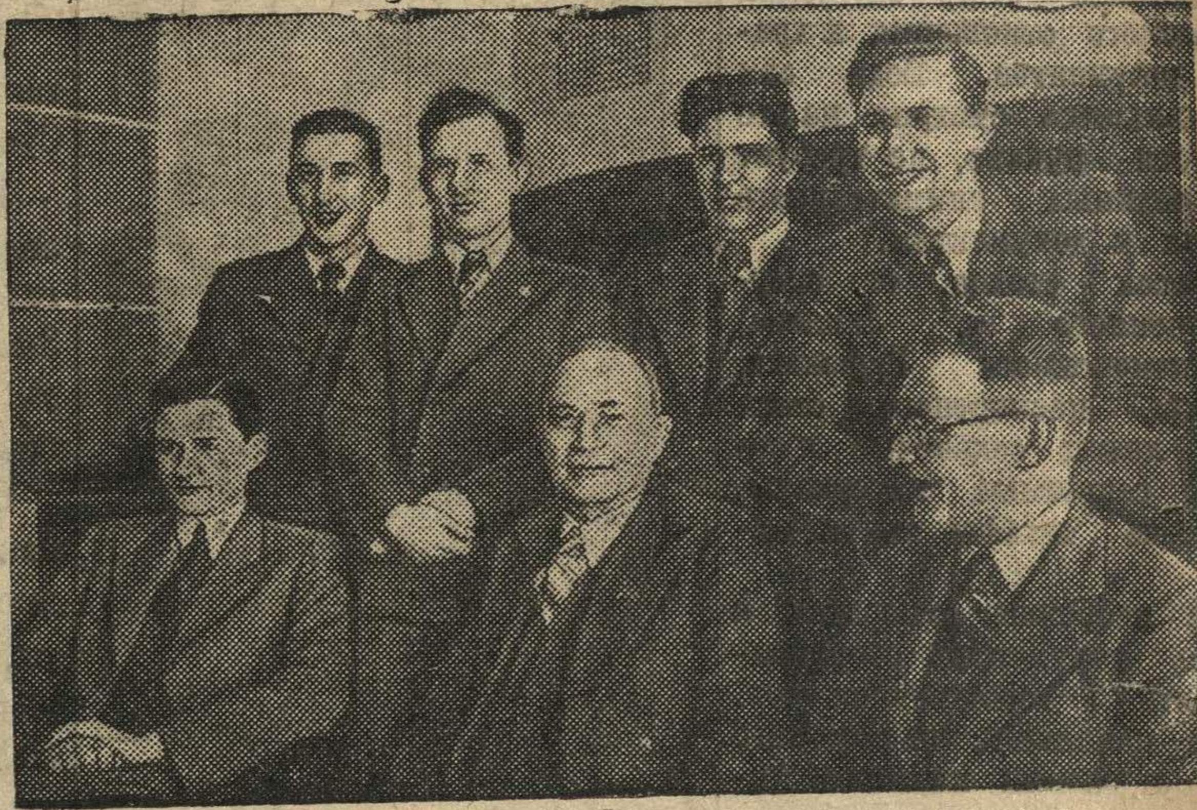
Тов. Куусинен среди участников турнира (слева направо): в первом ряду — П. Керес, О. Куусинен, М. Ботвинник; во втором ряду — И. Бондаревский, И. Болеславский, А. Лиленталь и В. Смыслов.

6-го апреля шахматный турнир в Ленинграде посетил Председатель Президиума Верховного Совета СССР и Председатель Президиума Верховного Совета Карело-Финской ССР товарищ О. Куусинен.