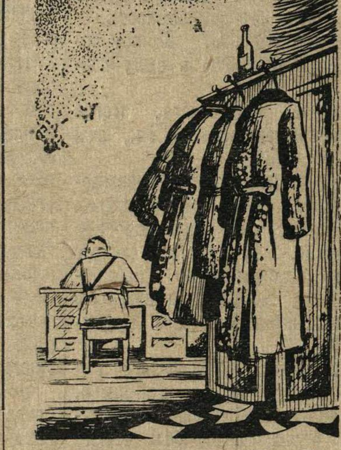
И шинели под рукой и беспорядков в шкафу не видно.