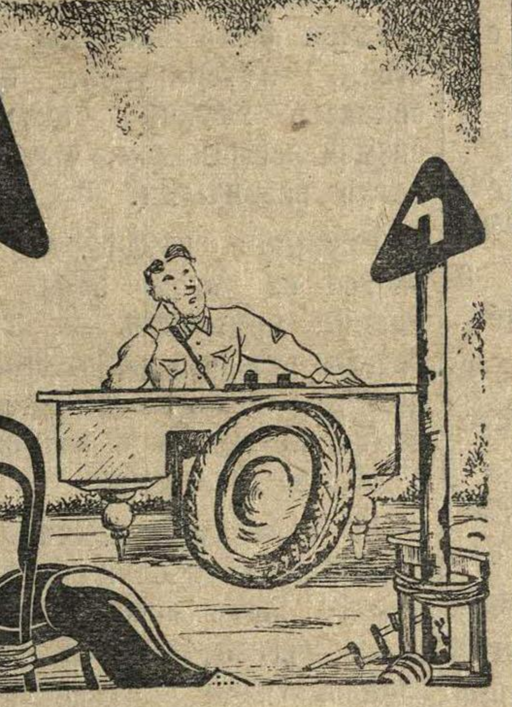
— Эх, маловат у меня кабинет, нунда автомобиль поставить.

До включения во Всесоюзный смотр стенгазета «Сталинец» 4 городского отделения считалась одной из худших в гарнизоне. Плохо оформленная, она пестрела грамматическими ошибками, выходила нерегулярно—в лучшем случае один раз в месяц. Чувствовалось, что редколлегии, политрук, партийная и комсомольская организации мало интересовались газетой.