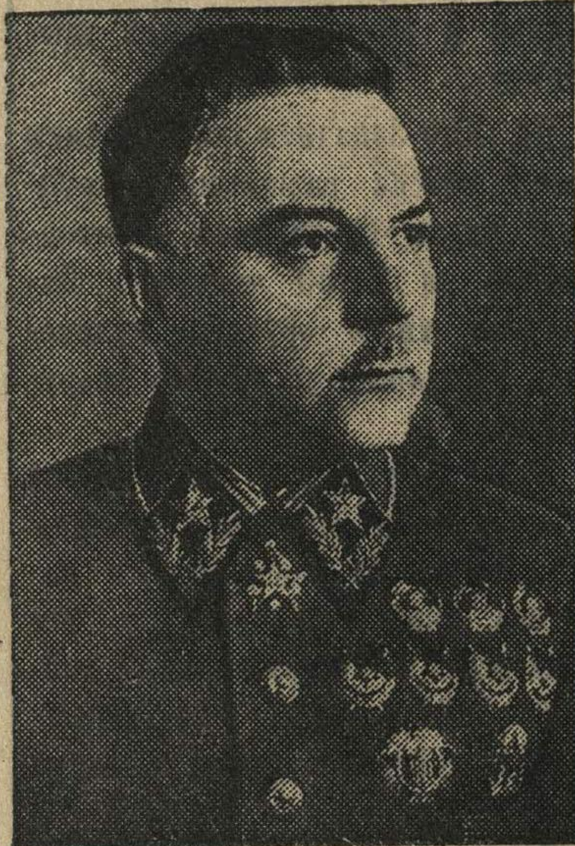
Главнокомандующий войск Северо-западного направления Маршал Советского Союза тов. К. ВОРОШИЛОВ.

По уполномочию Правительства Союза Советских Социалистических Республик Заместитель Председателя Совета Народных Комиссаров и Народный Комиссар Иностранного Дела— По уполномочию Правительства Его Величества в Соединенном Королевстве— Чрезвычайный и Полномочный посол Его Величества в СССР— В. МОЛОТОВ. СТАФФОРД КРИППС.