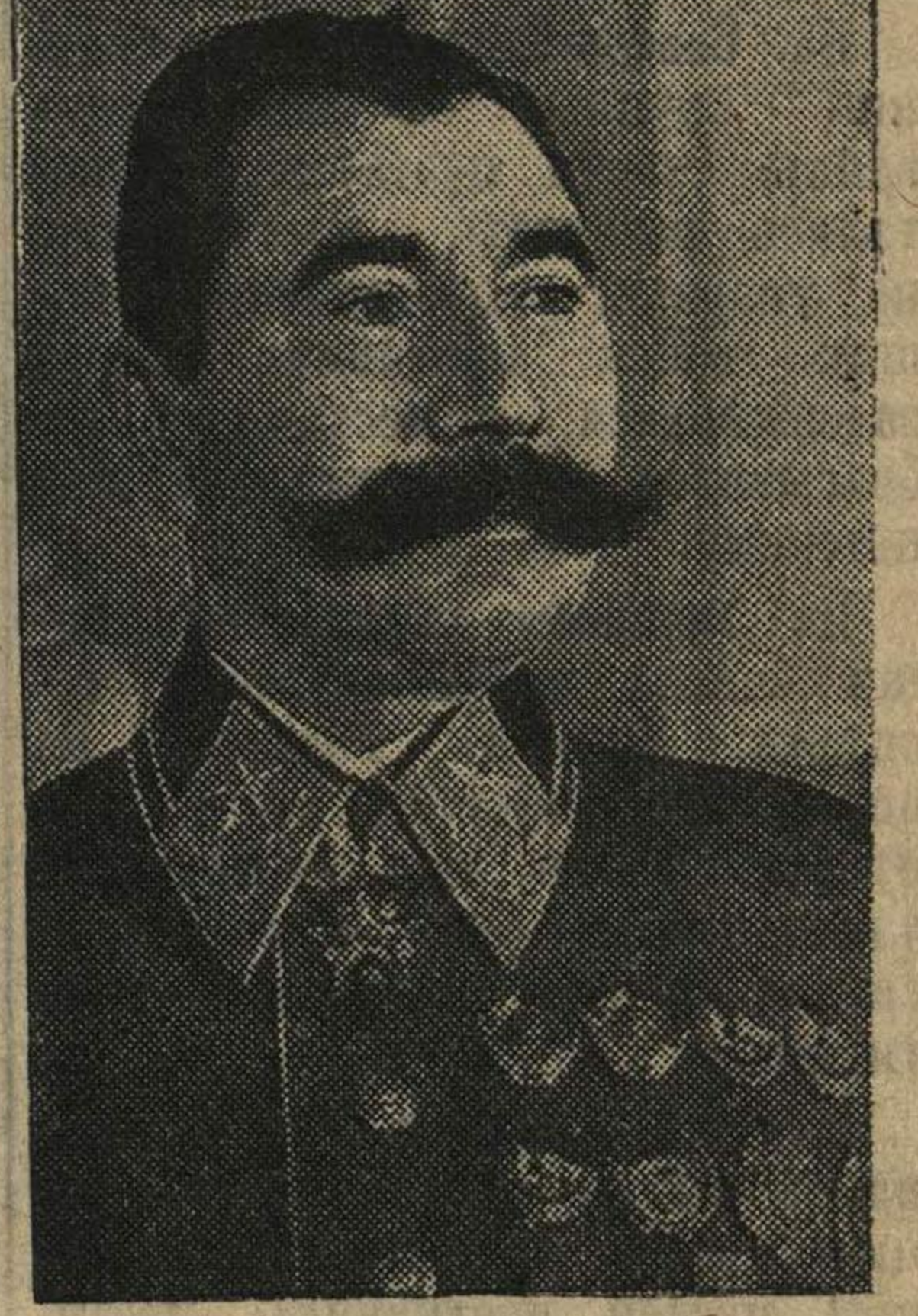
Главнокомандующий войск Юго-западного направления Маршал Советского Союза тов. С. БУДЕННЫЙ.