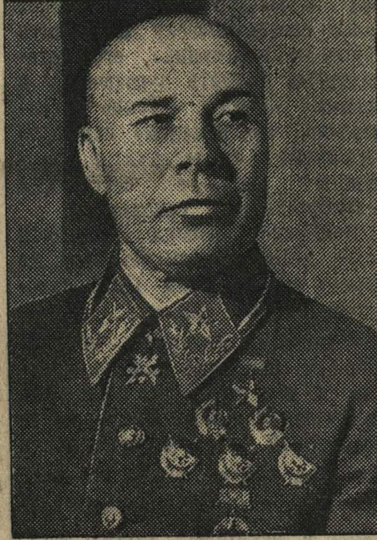
Главнокомандующий войск Западного направления Маршал Советского Союза Народный Комиссар Обороны тов. С. ТИМОШЕНКО.