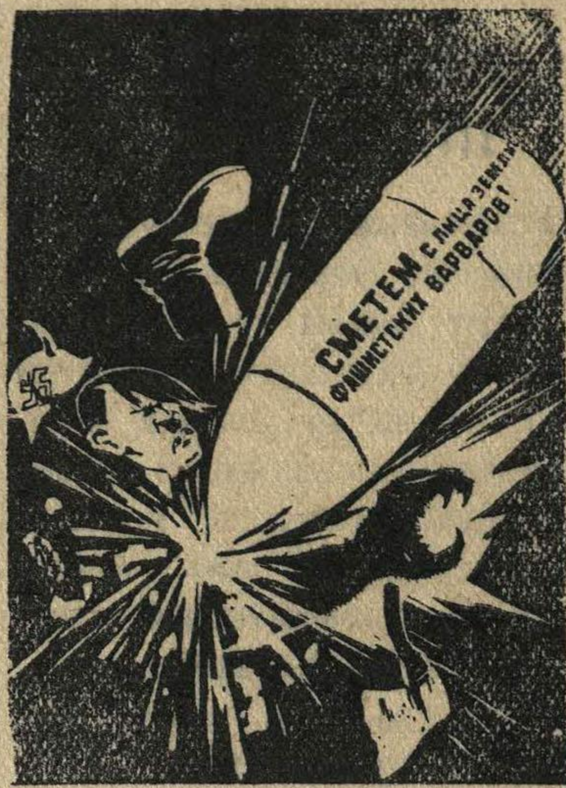
Планат художника Долгорукова.

Важнейшая задача работников милиции в кратчайшие сроки обеспечить подготовку населения к противовоздушной и противохимической обороне.