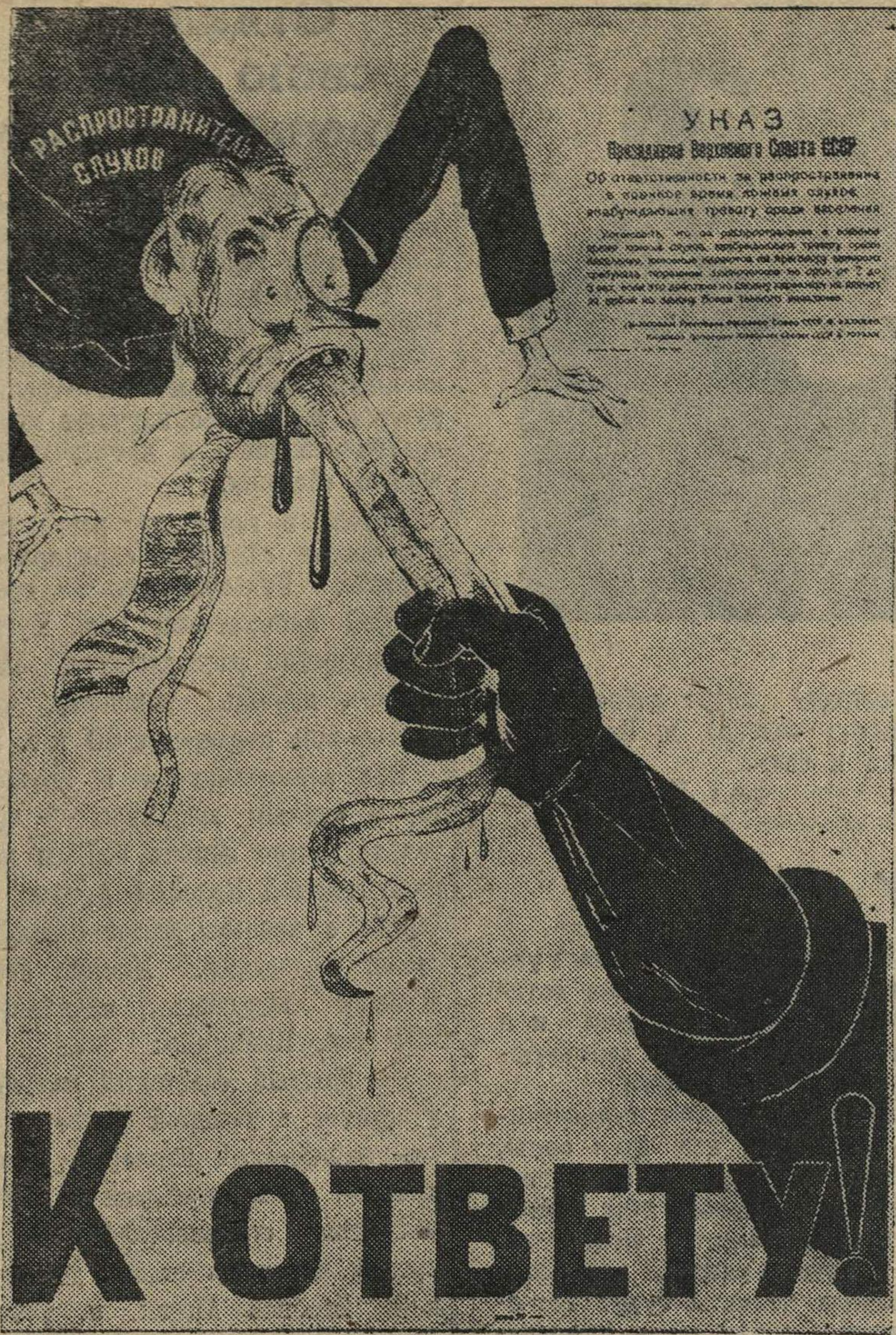
Плакат работы М. П. Костина, выпущенный Горьковским областным издательством.