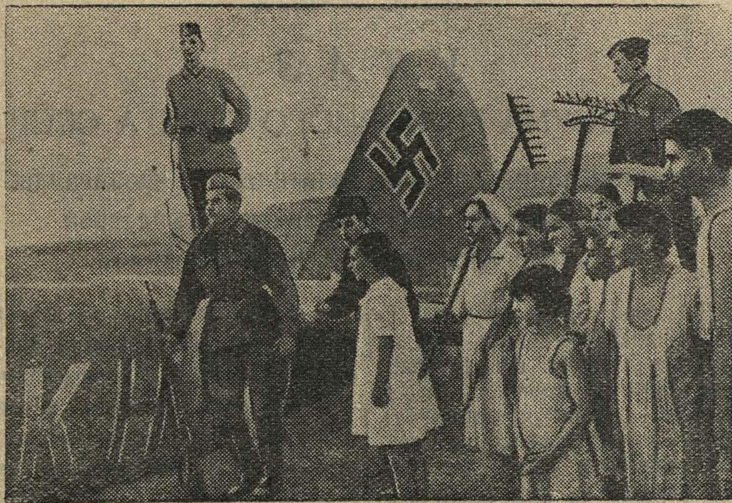
Действующая Красная Армия. На снимке: фашистский самолет, сбитый отважными советскими летчиками.