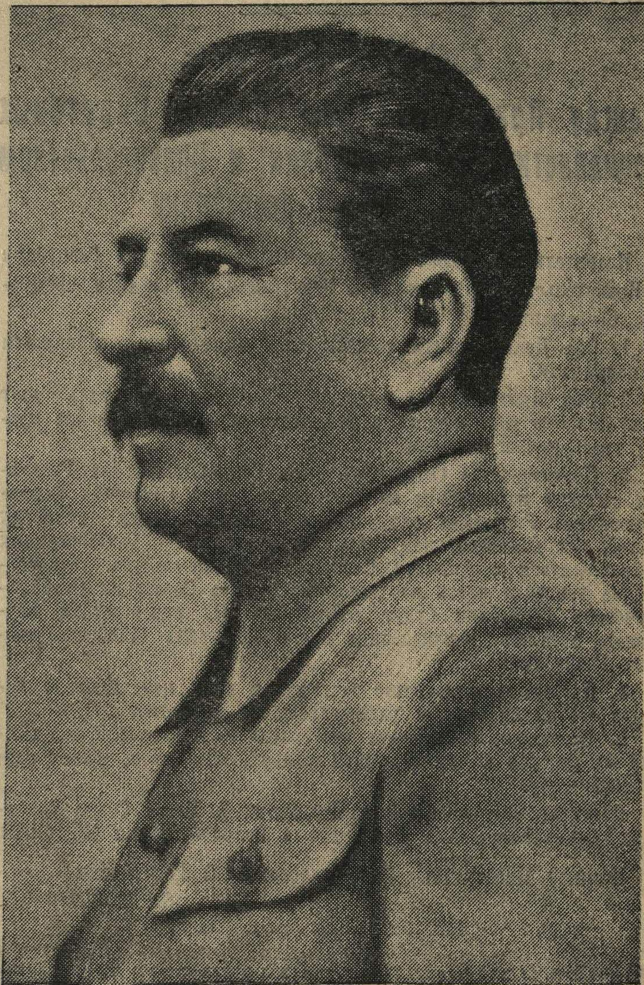
Утверждено Президиумом Верховного Совета СССР