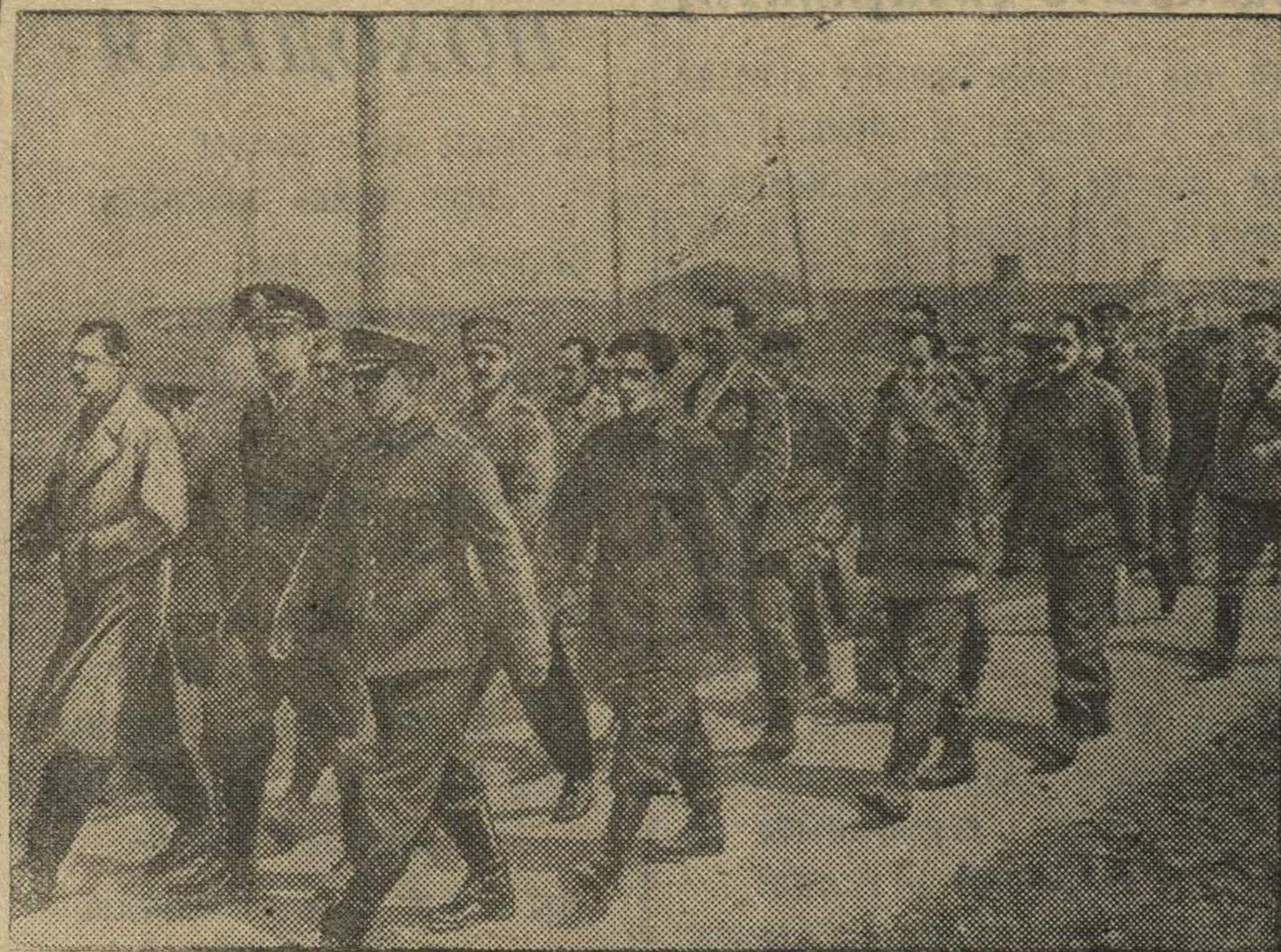
В действующей Красной Армии. На снимке: пленные немецкие офицеры и солдаты.

Советский народ не одинок в своей освободительной войне против гитлеризма. Гитлеризм — об-