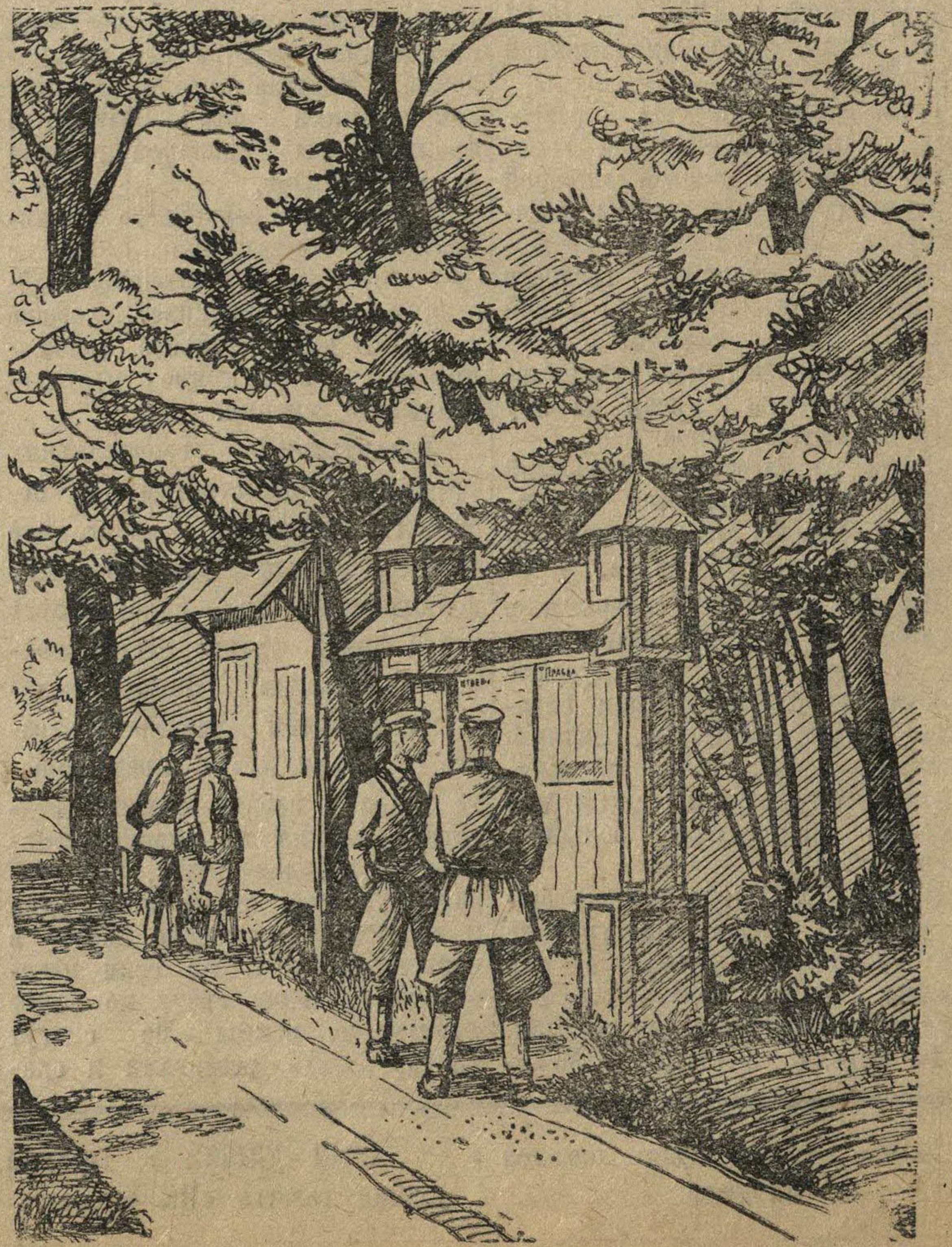
Рис. М. Костина.

Дежурь на участке своем хорошо, Чтоб враг никогда и нигде не прошел!