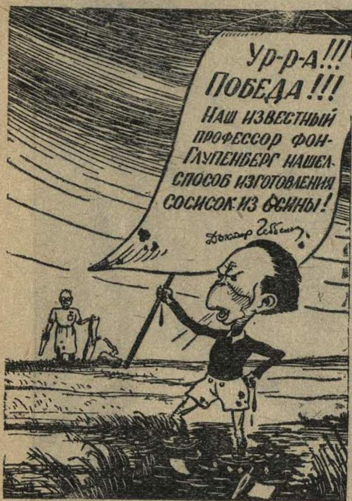
Рис. М. Костина.

(Из выступления г. Лозовского на пресс-конференции).