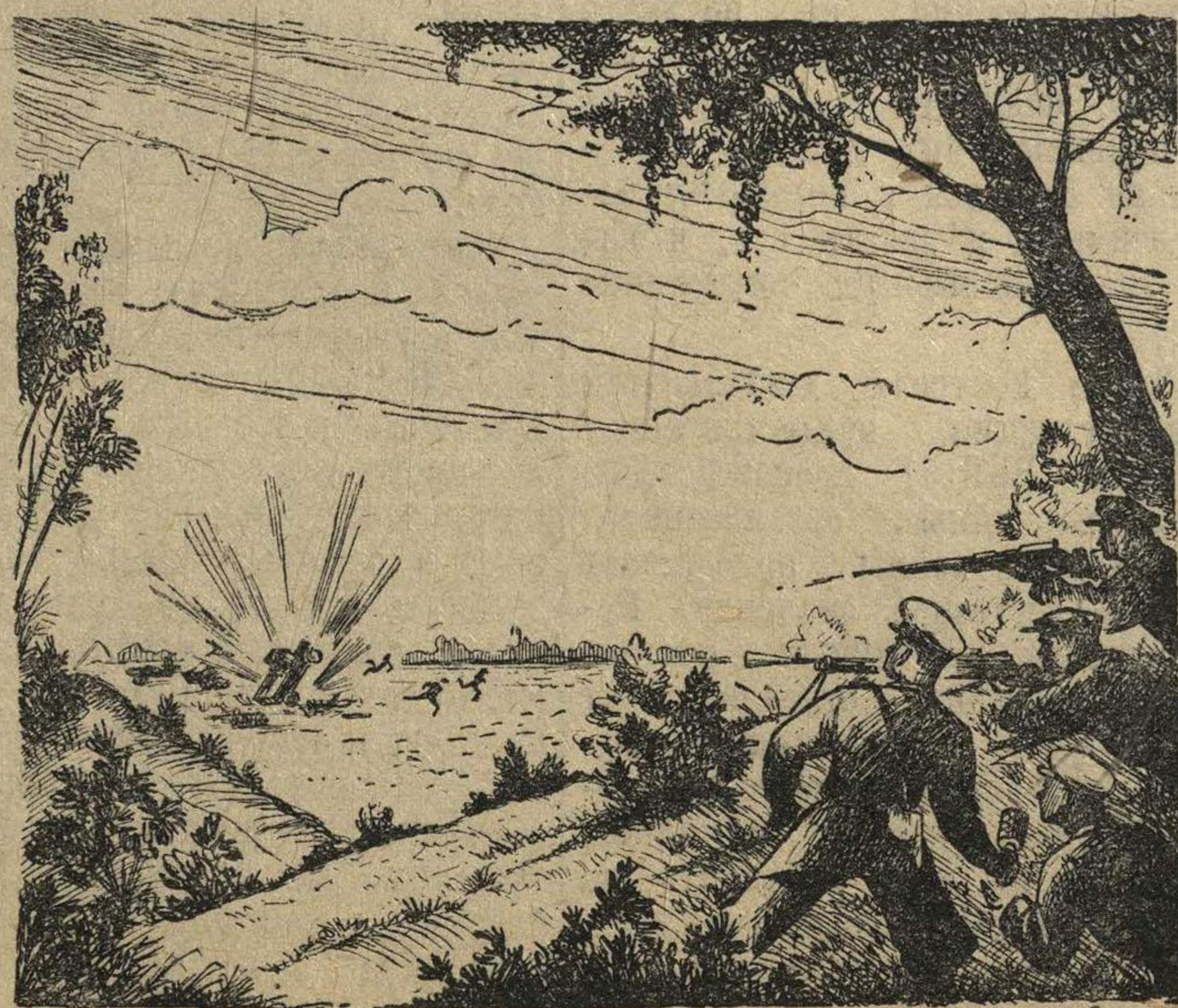
... Партизаны напали на немецких саперов...